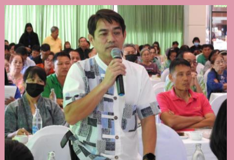
ผู้เข้าร่วมประชุมแสดงความคิดเห็น