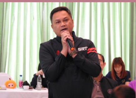
ผู้เข้าร่วมประชุมแสดงความคิดเห็น