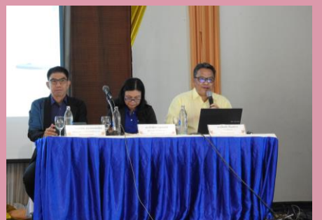
วิทยากรนำเสนอรายละเอียดโครงการ