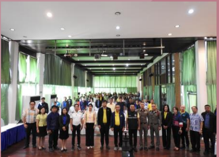
ผู้เข้าร่วมประชุมถ่ายภาพเป็นที่ระลึกร่วมกัน