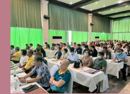
ผู้เข้าร่วมประชุมรับฟังรายละเอียดโครงการ