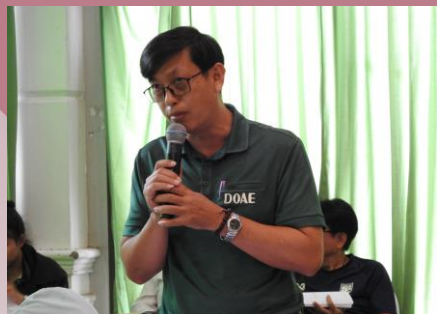
ผู้เข้าร่วมประชุมแสดงความคิดเห็น