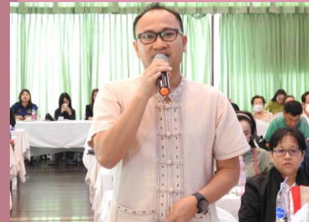
ผู้เข้าร่วมประชุมแสดงความคิดเห็น