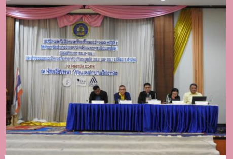
บริษัทที่ปรึกษาและผู้แทนกรมทางหลวงชนบท ตอบข้อซักถาม