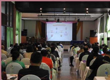
ผู้เข้าร่วมประชุมรับชมวีดิทัศน์โครงการ