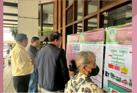
ผู้เข้าร่วมประชุมรับชมบอร์ดนิทรรศการ